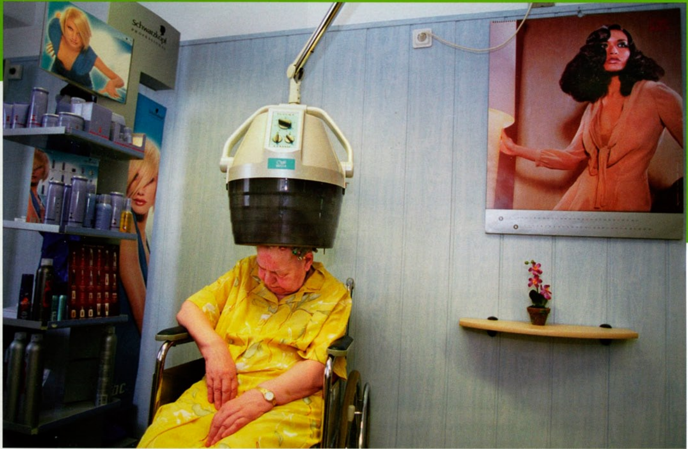
New Neighbours, fotoproject over de EU-uitbreiding. Kapsalon in bejaardenhuis Nijenstede, Amersfoort.